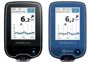
FreeStyle Libre/FreeStyle Libre 2 Lesegerät | FreeStyle Libre/FreeStyle Libre 2 reader

FreeStyle Libre/FreeStyle Libre 2 Sensor und Applikator sowie FreeStyle Libre 3 Sensor und Applikator, aufzubewahren bei 4–25 °C | FreeStyle Libre/FreeStyle Libre 2 sensor and applicator, as well as FreeStyle Libre 3 sensor and applicator, to be stored between 4 and 25 °C